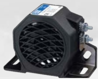
SA951 SURFACE MOUNT, SMART® ALARM, 77 - 97DB(A)

SOLUCIONES PARA SEGURIDAD EN EL RETROCESO | SOLUTIONS DE SÉCURITÉ EN MARCHÉ ARRIÈRE