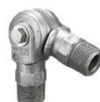
LAGSW34 (Soporte giratorio ajustable de 3/4")