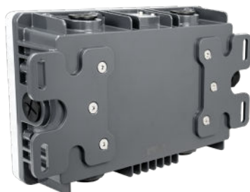
Pies de montaje estándar