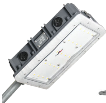
Conexión deslizante de poste