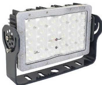
LSG033090TR o LSG02251180TR (Soporte Trunion)