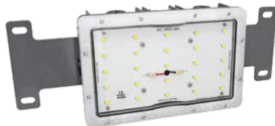
LAGJ5PH1 (Soporte dual)