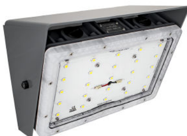
LAGJ5WM (Montaje en pared)